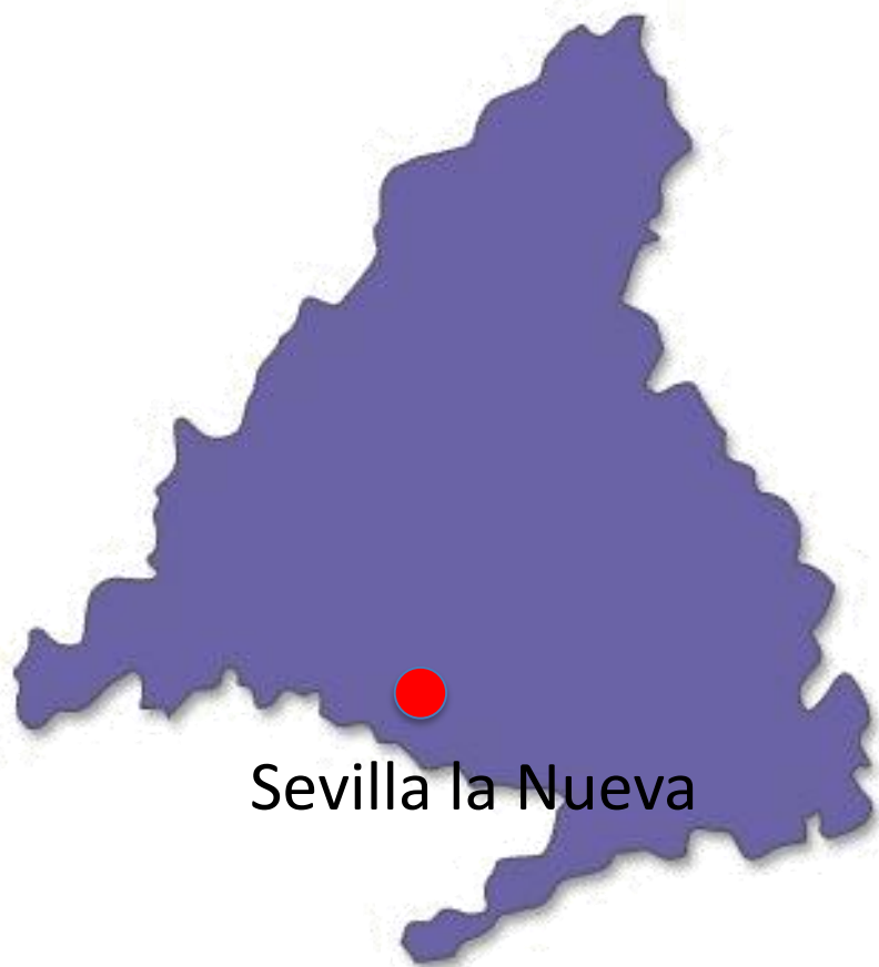
Sevilla la Nueva

En Sevilla la Nueva (Madrid), a 25 km de la Capital. En un entorno totalmente natural Lleno de encinas. En una zona de Especial Protección de Aves (ZEPA).